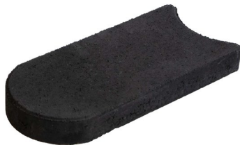
33 x 16 x 4,5 cm