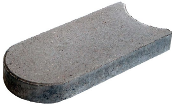
33 x 16 x 4,5 cm